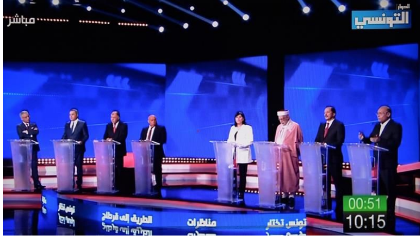
صورة: المناظرة الرئاسية الأولى في تونس، 2019